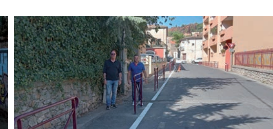
Cheminement piétonnier rue Hippolyte Guiraudou