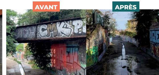
Retrait pont Hôpital