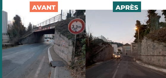
Retrait pont Cimetière