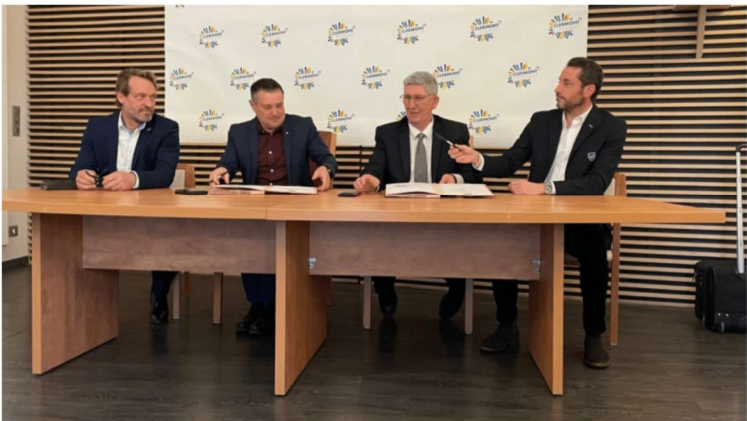
Signature à Clermont-l'Hérault de la convention de délégation de service public concernant le projet de crématorium, le vendredi 14 février 2025

Louise Brahiti Publié le 14 février 2025 à 19:02