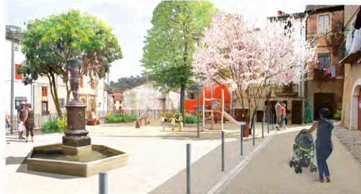
PERSPECTIVE DE LA PLACE DU RADICAL