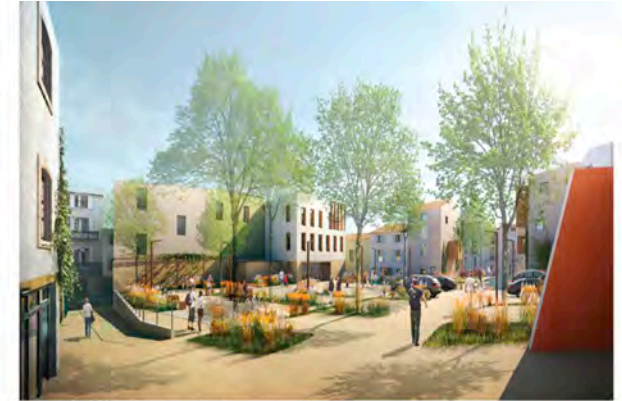
PERSPECTIVE DE L'ÎLOT D'ENOZ